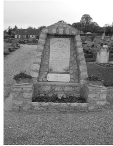
Monument aux Morts de Collemiers