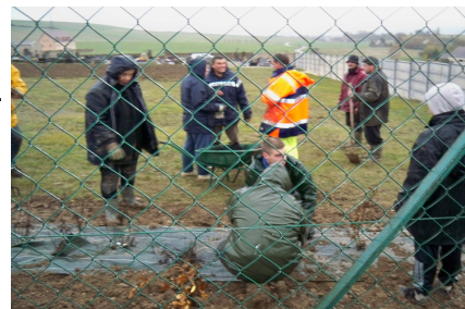
Plantations au cimetière

- Participation au marché de Noël, plantation d'une centaine d'arbres et arbustes, achetés par la commune, dans le cadre de l'aménagement paysager du cimetière, ébauche de décoration du village pour les fêtes de fin d'année.