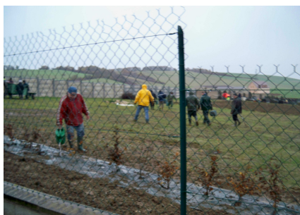
Bénévoles en action

Outre l'entretien des ouvrages existants, d'autres projets sont à l'étude. Par ailleurs, l'association propose à ses adhérents des réunions à thèmes tels: le jardin au naturel, le compostage, le bouturage, la taille (avec atelier pratique).