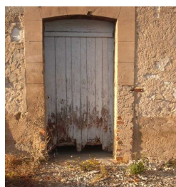
Porte avant travaux