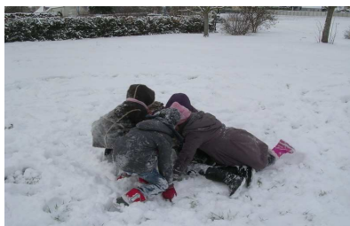
Neige en Décembre