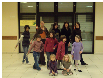
Les majorettes de Collemiers