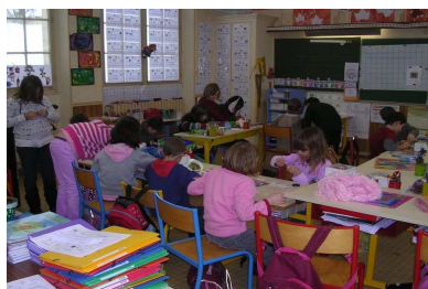
Veille de vacances de Noël

De l'école d'horticulture de Gron sont venus nous expliquer ce qu'était un bulbe, comment le planter et le préserver.